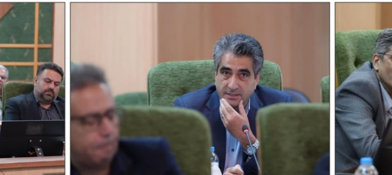
رئیس اتاق اصناف کرمانشاه:

مدیرکل صمت کرمانشاه تأکید کرد: ما در مجموعه دولت برای رفع موانع و تسهیل امور در کنار اصناف هستیم، اما با نظارت هوشمندانه و مدیریت موثر، اجازه نخواهیم داد رفتارهای سودجویانه، پایداری بازار استان را به هم بزند.