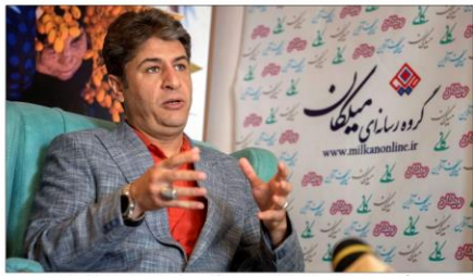
رئیس سازمان نظام صنفی رایانه کرمانشاه: