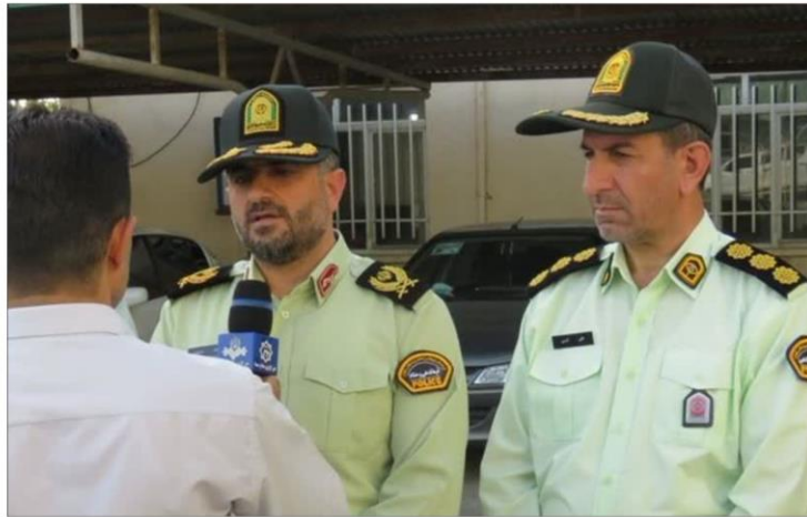
فرمانده انتظامی استان کرمانشاه تصریح کرد: در تحقیقات تکمیلی کارآگاهان مشخص شد سارقان که ۳ نفر بوده اند از طریق سقف انبار بخش اورژانس توانسته بودند به اتاق رادیوتراپی راه پیدا کرده و در ظرف مدت ۴ ماه به تدریج سرب ها را خارج کنند.

وی با بیان اینکه کارآگاهان پلیس آگاهی در تحقیقات ابتدایی خود دریافتند تعدادی از سرب های اتاق رادیوتراپی که باعث جلوگیری از تشعشع اشعات این اتاق می شود به سرقت رفته است، افزود: با بررسی صحنه جرم مشخص شد این اتفاق توسط تعدادی از نیروهای خدماتی بیمارستان صورت گرفته است.