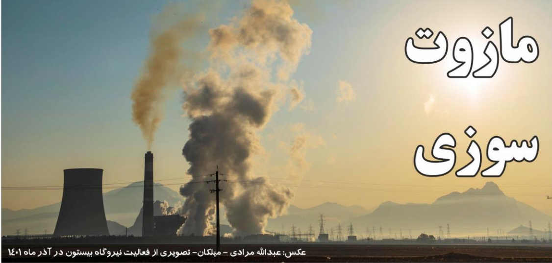
تصویری از فعالیت نیروگاه بیستون در آذر ماه ۱۴۰۱