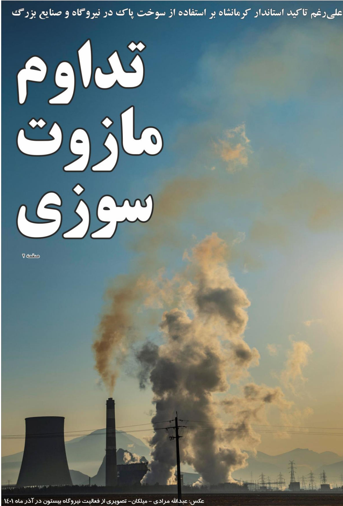
عکس: عبدالله مرادی - میلکان - تصویری از فعالیت نیروگاه بیستون در آذر ماه ۱۴۰۱