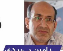
رامتین پی‌برداری کارشناس گردشگری