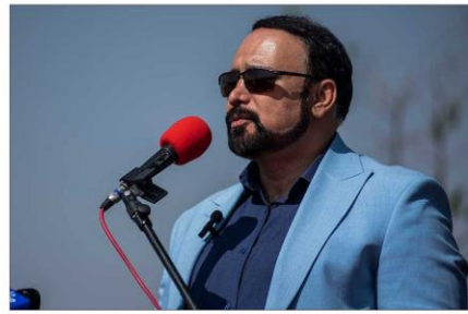
شهردار کرمانشاه خبر داد: