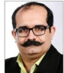
سرمایه‌گذار کرمانشاه نیازمند آسیب‌شناسی